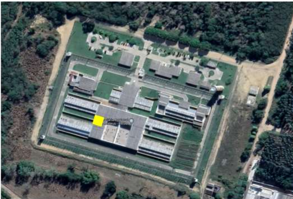
Foto 4: Localização da oficina na PRSM.