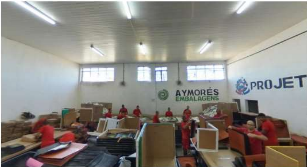
Foto 1: espaço vistoriado.